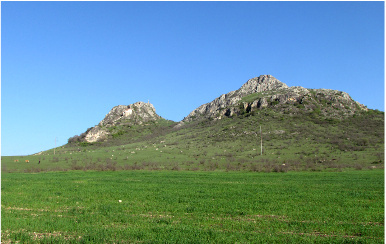
Il paesaggio tipico della Chachuna Reserve: coltivi, praterie, steppe, e qualche basso rilievo roccioso