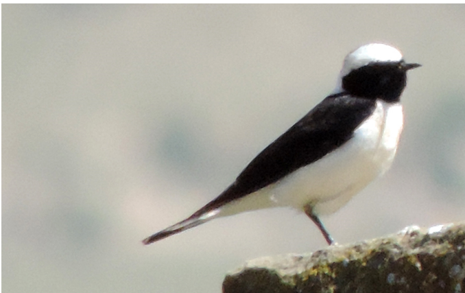
La Monachella dorsonero, insieme al Culbianco isabellino, è stata l' Oenanthe più interessante del tour

cinque individui a Chachuna, uno della forma vittata al reservoir di Dalis; tre lungo la strada per David Garelj